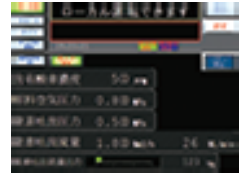
運転状態をタッチパネル表示